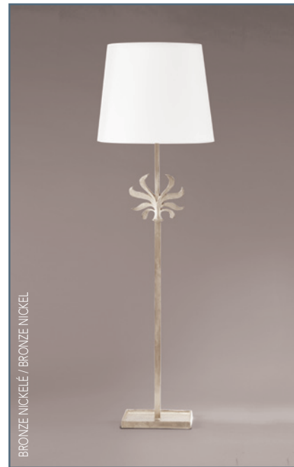
BRONZE NICKELÉ / BRONZE NICKEL