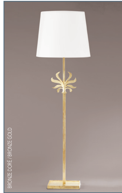
BRONZE DORÉ / BRONZE GOLD