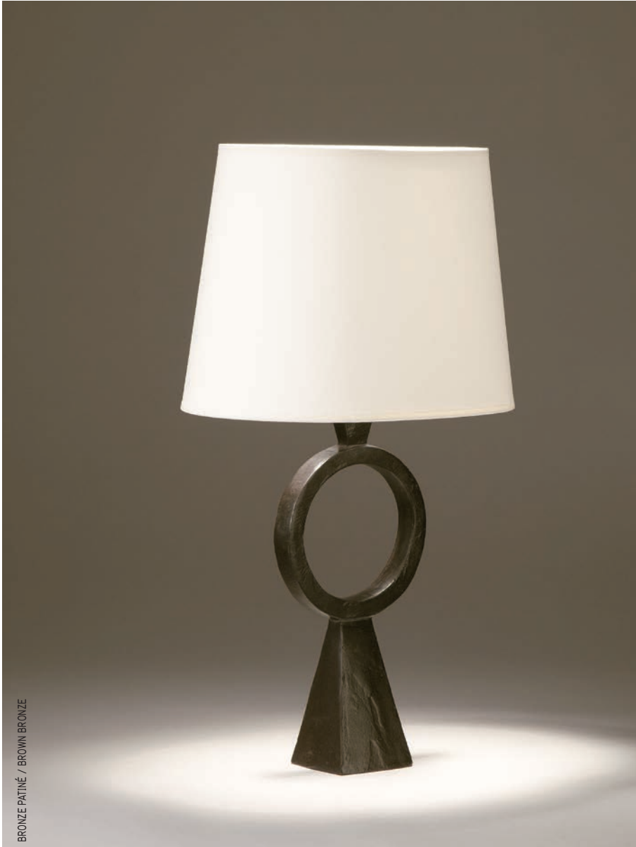
BRONZE PATINÉ / BROWN BRONZE