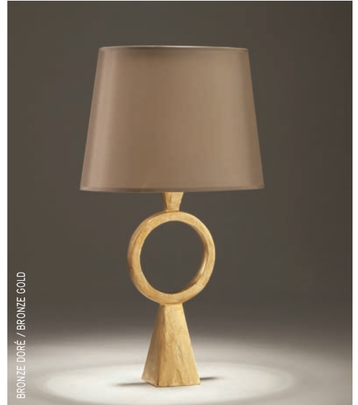
BRONZE DORÉ / BRONZE GOLD