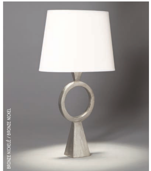
BRONZE NICKELÉ / BRONZE NICKEL