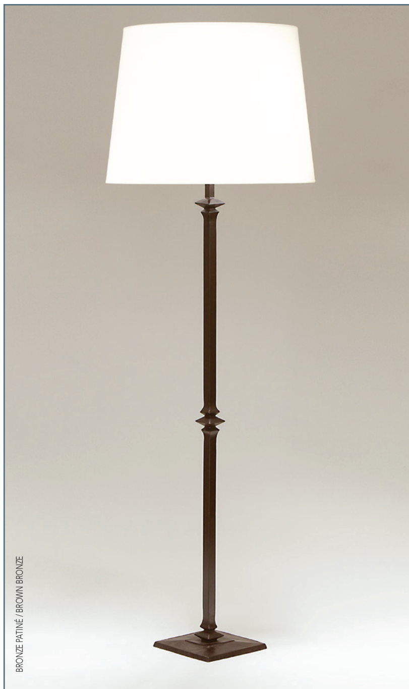
BRONZE PATINÉ / BROWN BRONZE