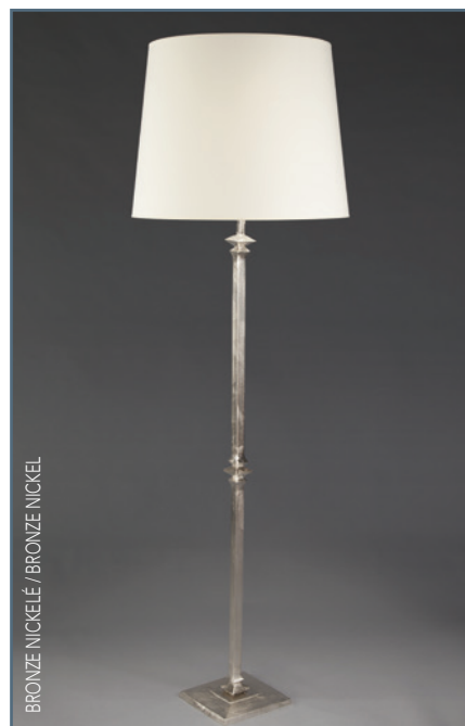
BRONZE NICKELÉ / BRONZE NICKEL