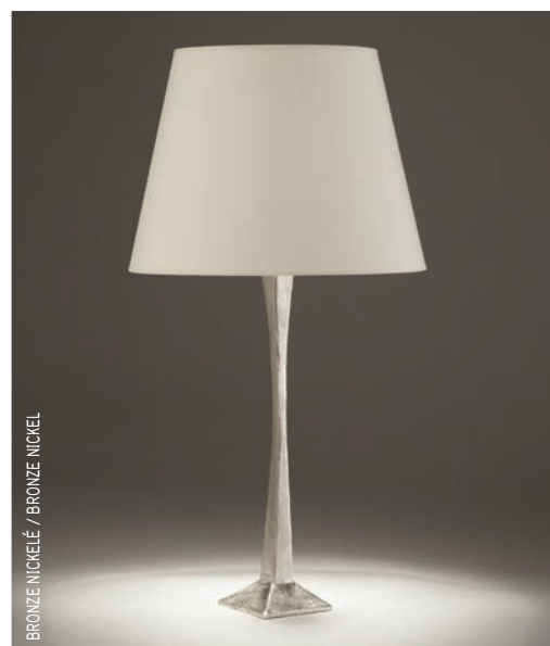
BRONZE NICKELÉ / BRONZE NICKEL