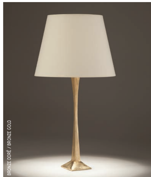
BRONZE DORÉ / BRONZE GOLD