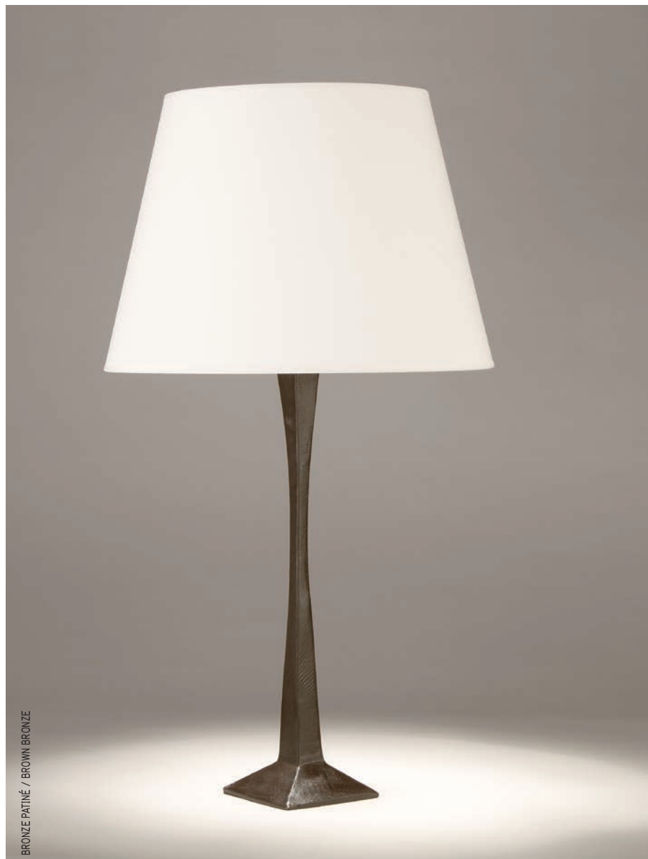
BRONZE PATINÉ / BROWN BRONZE