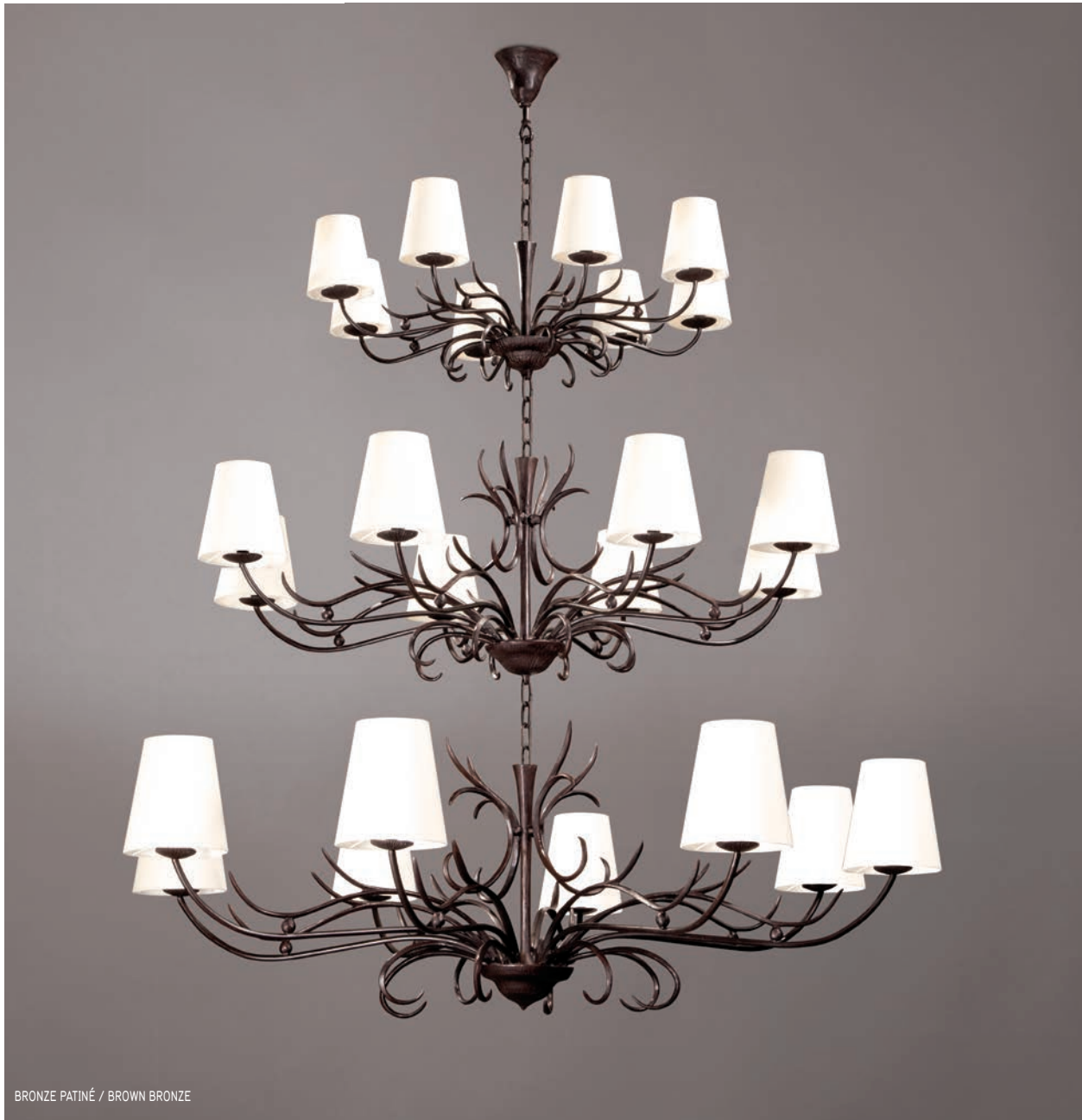
BRONZE PATINÉ / BROWN BRONZE